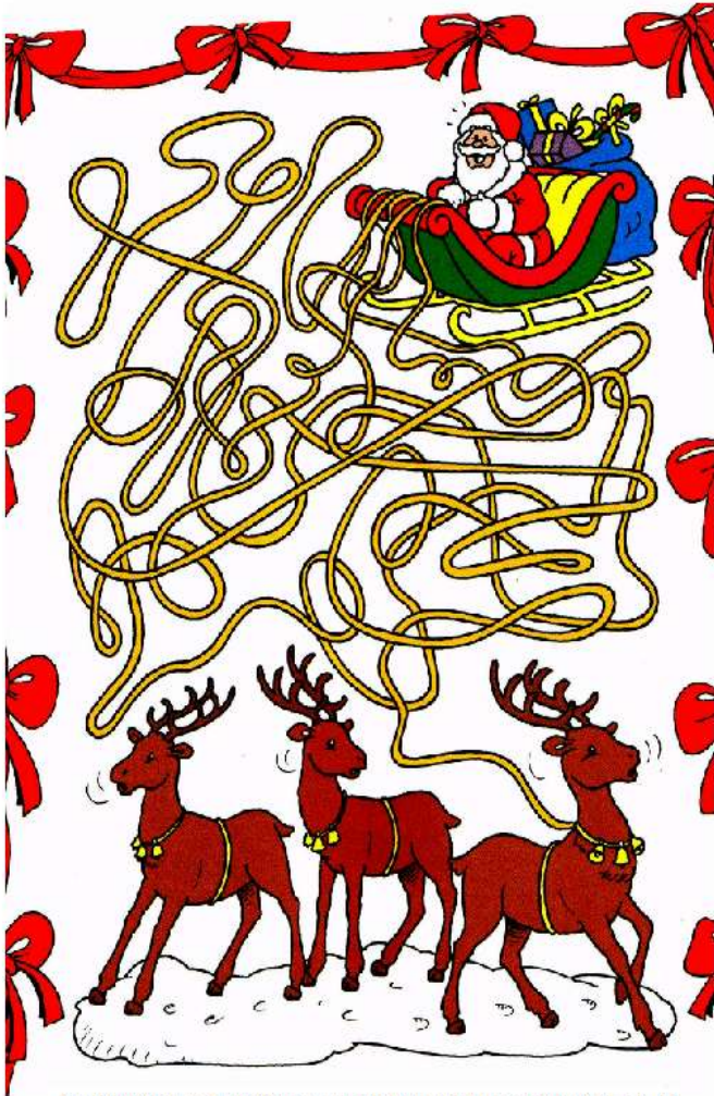
Τα χαλινάρια του ελκήθρου μπερδεύτηκαν. Ποιο χαλινάρι πρέπει να κρατήσει ο Αϊ-Βασίλης για να οδηγήσει τον τάρανδο;