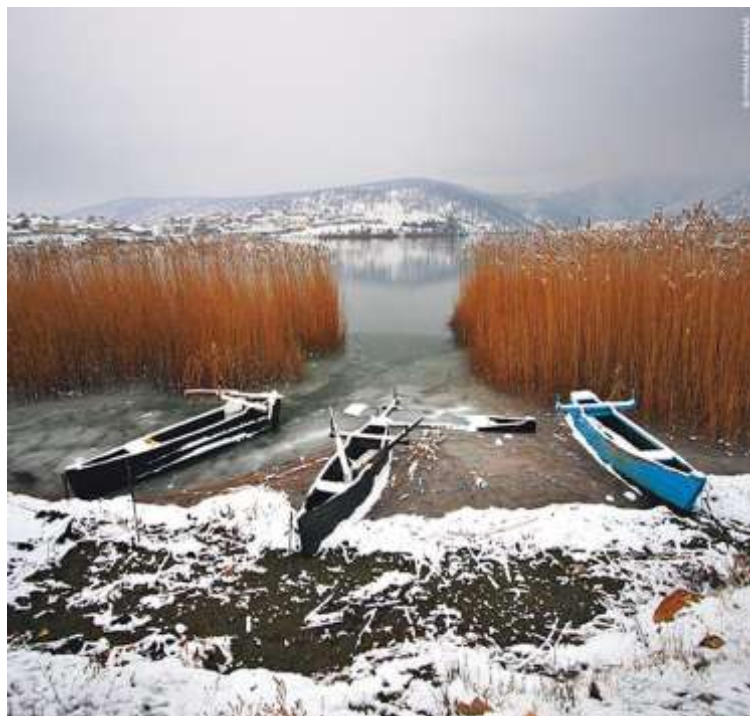
Λίμνη Ζάζαρη, Φλώρινα

Από τις πάπιες που κάνουν περίπατο στη «γυάλινη» πίστα της Κερκίνης ως τα «παγωμένα λουλούδια» ή τις φουσαλίδες πάγου στην Αμερική, οι λίμνες σε όλο τον κόσμο μεταμορφώνονται σε εξωπραγματικά μαγικά τοπία, ντυμένα στα λευκά.