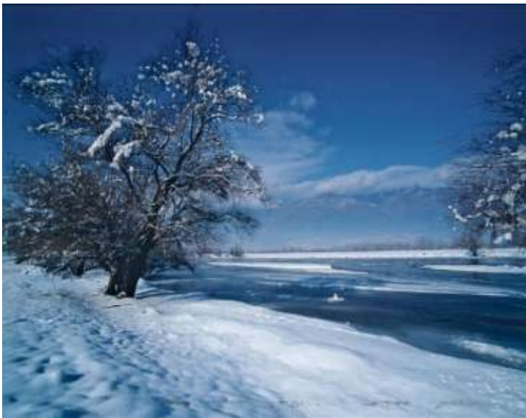
Λίμνη Κερκίνης, Σέρρες