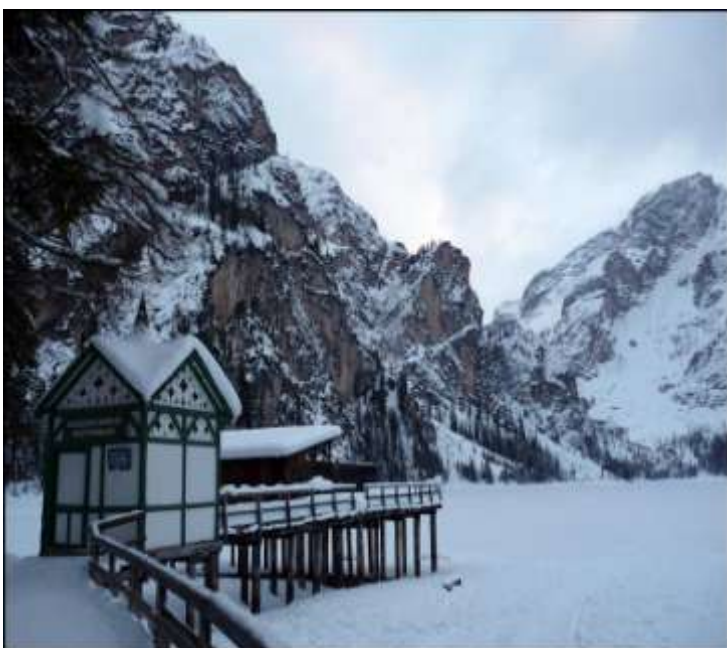
Λίμνη Braies, Δολομίτες, Ιταλία