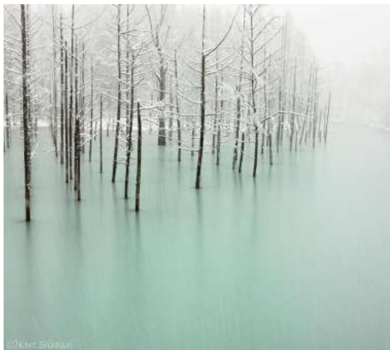
Λίμνη Blue Pond, Ιαπωνία