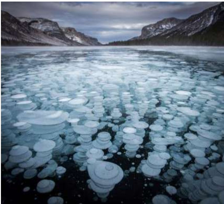
Λίμνη Αβραάμ, Καναδάς