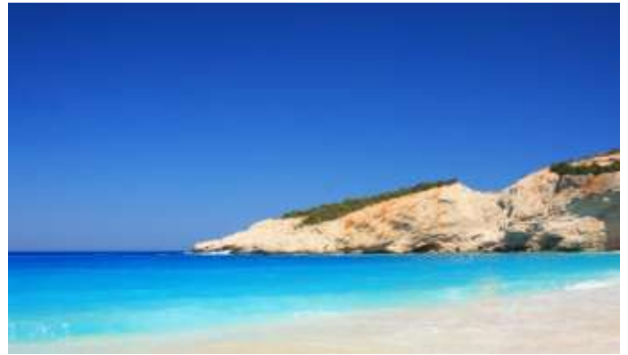
Πόρτο Κατσίκι Λευκάδα