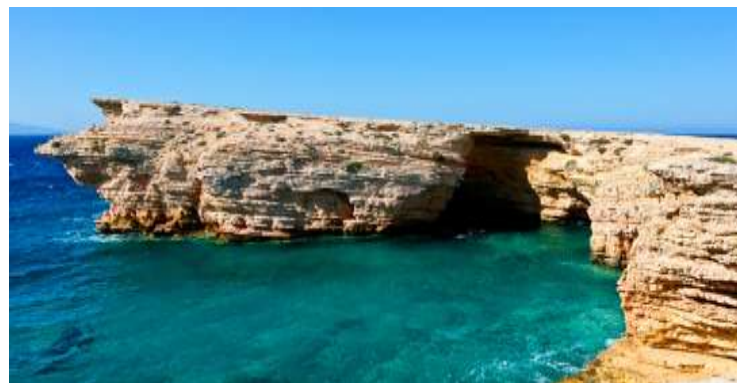
Πορί Άνω Κουφονήσι