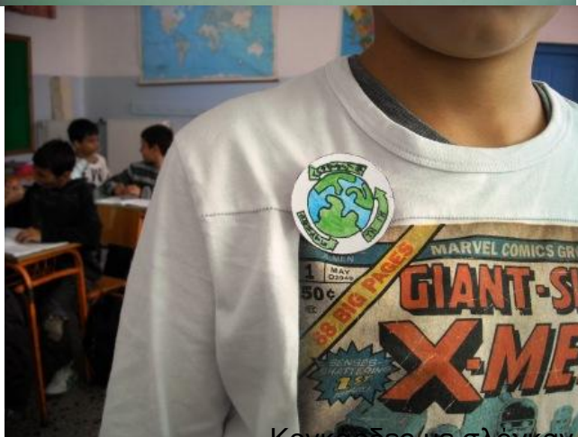
Κονκάρδες με σλόγκαν για την ενέργεια