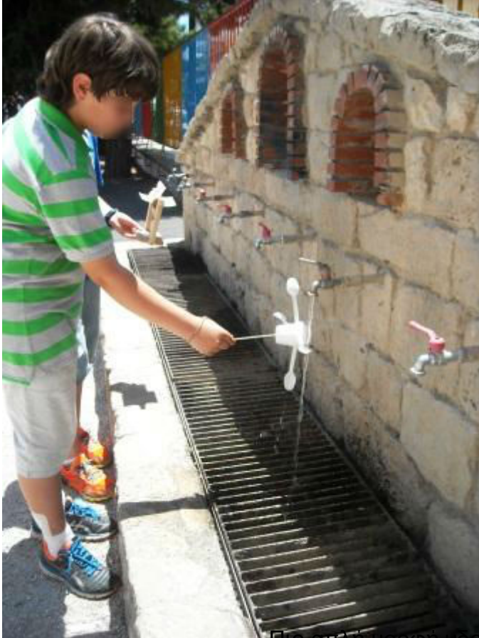
Πιο απλή μορφή προστρόβιλου